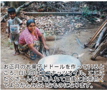
お正月のお菓子ドールを作っているところ。白いのはココナッツオイル。ここにたくさん砂糖を入れて最後には茶色くてようかんみたいなおものになります。