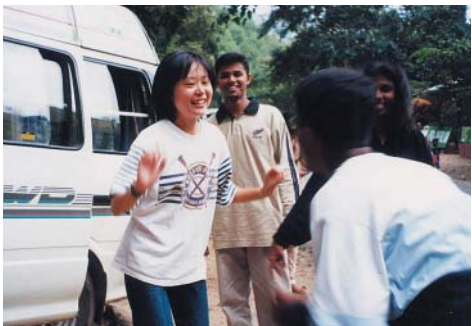
食後はみんなでダンス。旅のお決まり...らしい。私もおどりました。

半ごろには片付けて掃除して学校を出発。それから、名所を見たり、川や滝で水浴び(お風呂)をしたり、ご飯を食べたり、ダンスをしたり。