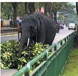
現地は、こんな風景かも？