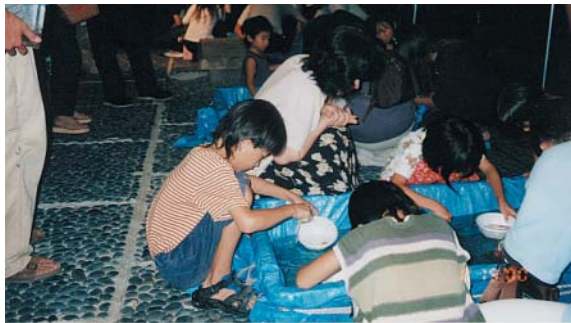
うーん、むつかしいな

金魚すくいなどは水車のあ る庭園で行いましたが、へそ 公園から「庭園」までは、夜 は暗闇になるので、提灯をつ ける作業から始まりました。 のぼり立て、沢ガニの運搬、 シャボン玉の作成などメン バーそれぞれが道具を持ち寄 り、分担し合って目標に向