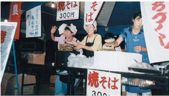
さー、いらっしやい