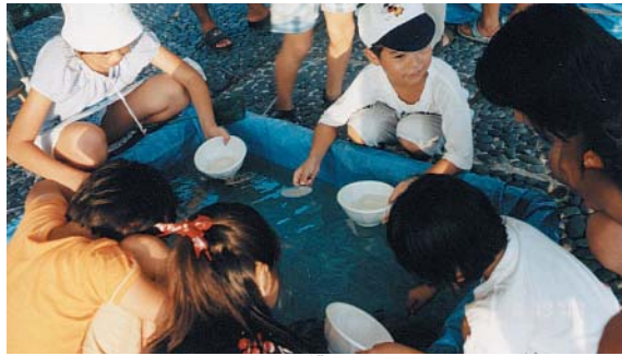
お母さん見て、僕とるからね

に行われました。 比也野里まちづくり委員会 では、昨年に引き続き金魚す くい・焼きそば販売、そして