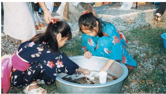
沢ガニ、さわるのかわいい