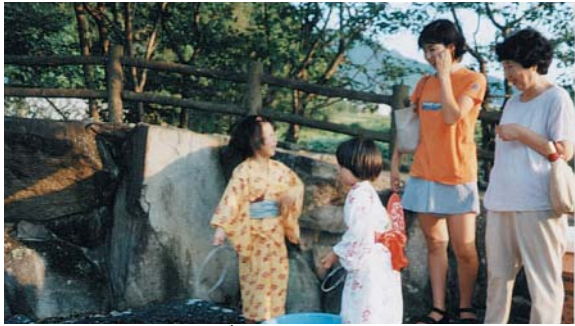
お母さんシャボン玉うまくできたよ