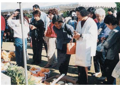
昨年のフリーマーケットは大人気でした

開催日 二〇〇〇年十月二十二日(日) 開催時間 十時～十四時 開催場所 西脇市へそ公園 規模 一〇〇店程度 (先着順) 参加費 千円 参加資格 どなたでもかまいません。高校生以下は、親